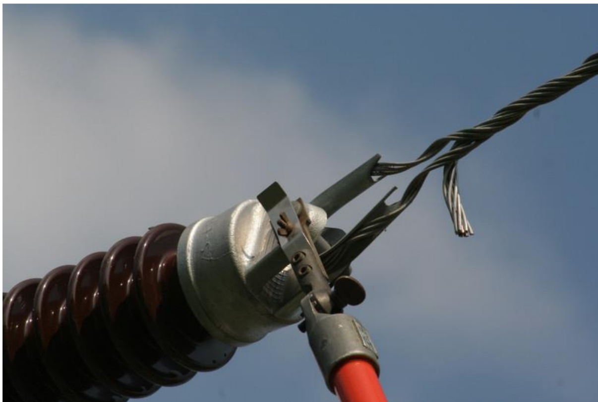
Exemplu de utilizare port-bulon pentru manevrarea unui bolț de la un izolator de întindere