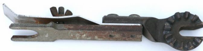
Exemplu de port-bulon

Port-bulonul este un dispozitiv utilizat pentru ținerea unui ax sau a unui bulon. Acest dispozitiv este o sculă adaptabilă cu capăt canelat concepută pentru a fi utilizată cu prăjina universală.