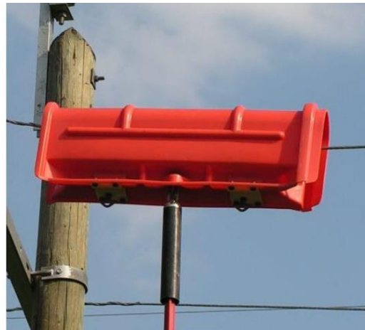
Exemplu de utilizare: instalarea unui capac de protectie