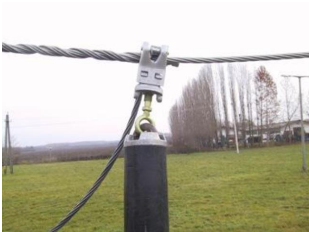
Exemplu de utilizare: fixarea unei cleme de legatura electrica