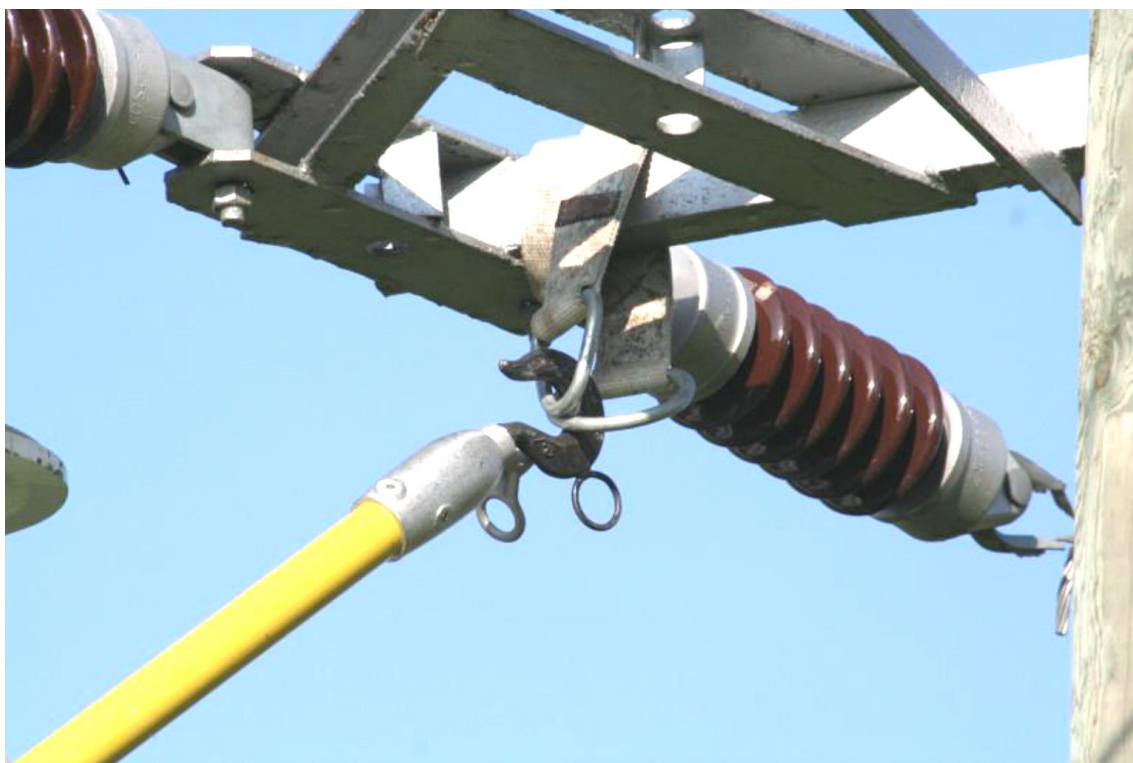
Exemple de utilizare a unor chingi.