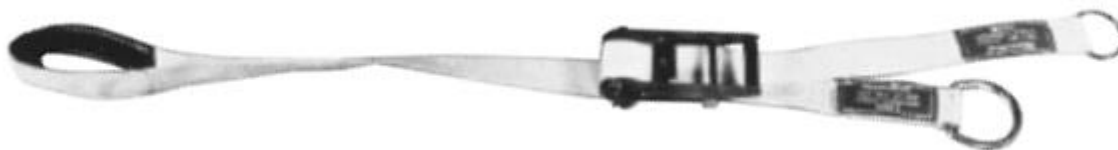
Fig. 3 Exemplu de chingă ajustabilă