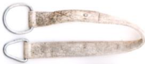
Fig. 1 Exemplu de chingă cu inele

Chingile sunt accesorii de fixare și manevrare încărcăturilor de orice natură, stâlpi, console, izolatori. Se utilizează pentru crearea forțelor de împingere/tracțiune ale unor elemente ale rețelei.