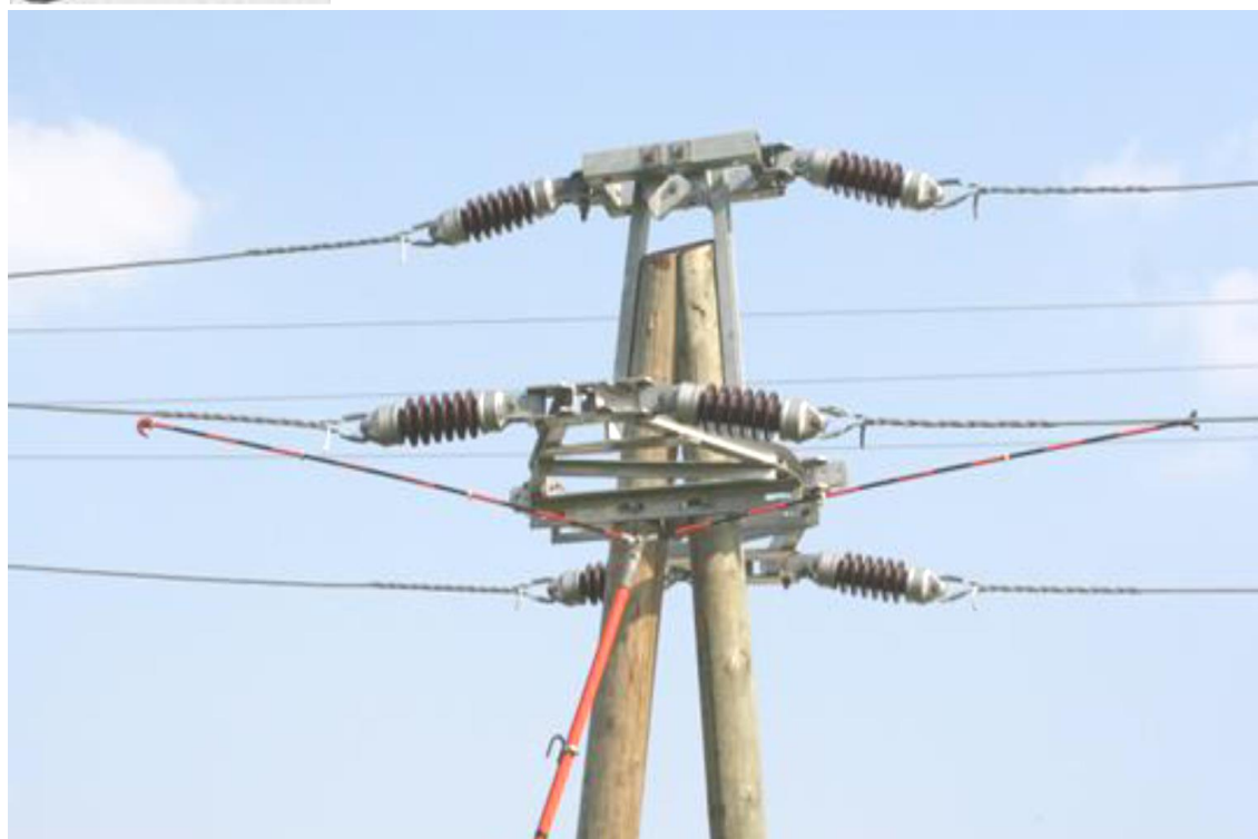
Exemplu de utilizare a unei tije pentru măsurarea lungimii unui ștrap