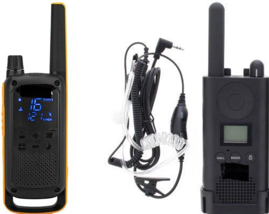
Exemple de stații walkie-talkie (cu caști)

Stațiile radio walkie-talkie sunt concepute pentru realizarea comunicării între membrii echipelor de lucru sub tensiune sau între instructori și electricieni în timpul instruirilor din poligoanele specializate LST.